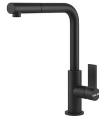
Mischbatterie Omega Plus Matt Black 8498 626