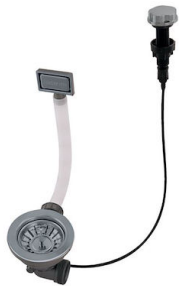
Automatischer Abfluss Gun Metal - PG