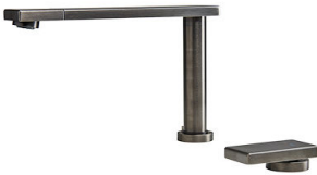
OP GUN METAL satiniert 8499 106