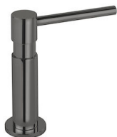
Spender Evo Gun Metal 8520 856