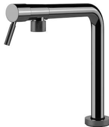
Mischbatterie Margot Gun Metal 8524 006