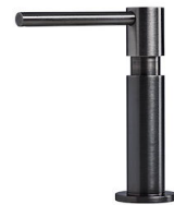
Spender Evo satiniert Gun Metal 8520 156