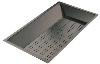
Perforierte Edelstahlwanne PVD Gun Metal 8151 006 * nur in Kombination mit dem Zubehör 8644 101