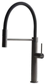
Mischbatterie Skin Gun Metal 8424 856