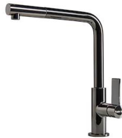
Mischbatterie Omega Plus Gun Metal 8498 856